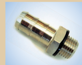
Conector de manguera de 3/8" para pistola estándar no de artículo ..... 096057