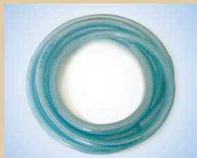
Manguera de 1/2" (50 m) no de artículo ..... 096035 Manguera de 3/8" (50 m) no de artículo ..... 096031