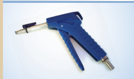
Pistola Bates Flex con enganche, no de artículo 096248