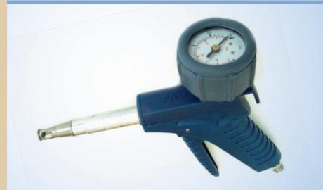
Pistola Bates Flex con manómetro de Ø40 mm no de artículo 096049