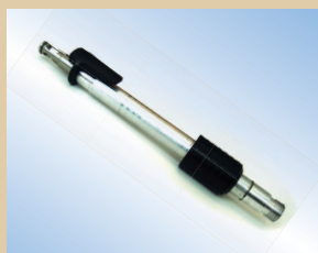
Boquilla de llenado, pistola Flex, aluminio, 150 mm con enganche y liberación de aire, no de artículo ..... 096228