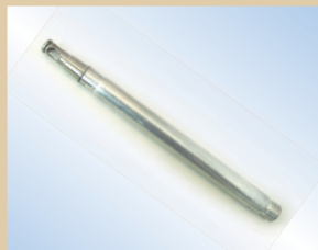
Boquilla de llenado, pistola Flex, aluminio, 150 mm, no de artículo ..... 096008