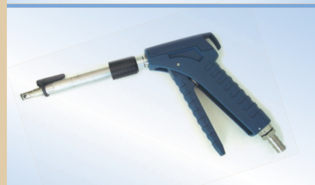
Pistola Bates Flex con enganche y liberación de aire, no de artículo 096259