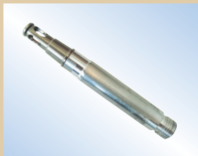
Boquilla de llenado, pistola Flex, aluminio, 80 mm, no de artículo ..... 096040