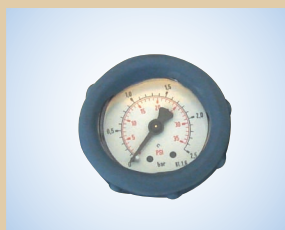
Manómetro con carcasa protectora (Ø40 mm – escala 0-2,5 bar), no de artículo ..... 096053