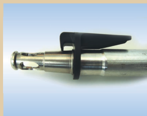
Boquilla de llenado, pistola Flex, aluminio, 80 mm con enganche, no de artículo ..... 096240