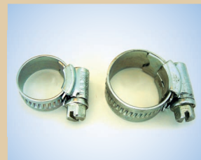
Abrazadera de 1/2" no de artículo ..... 096036 Abrazadera de 3/8" no de artículo ..... 096033