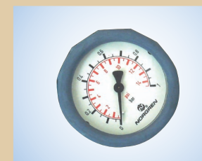
Manómetro con carcasa protectora (Ø63 mm – escala 0-1,0 bar), no de artículo ..... 096041