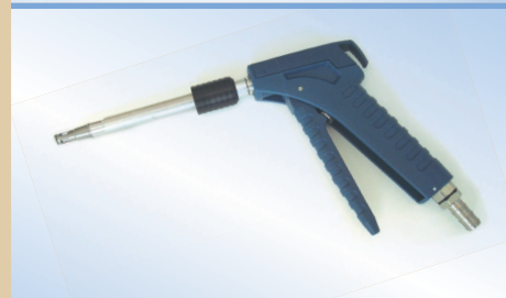
Pistola Bates Flex con tubo de 150 mm y liberación de aire, no de artículo 096059