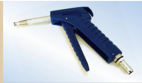
Pistola Bates Flex con tubo de 80 mm, no de artículo 096048

Enganche: La pistola Bates Flex está disponible con un sistema de enganche. La ventaja del enganche es que permite sujetar el inflador al airbag, de modo que puede inflar éste con una sola mano. Tras inflar, basta con presionar sobre el "bloqueo" para liberar la pistola.