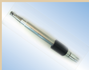
Boquilla de llenado, pistola Flex, aluminio, 150 mm con liberación de aire, no de artículo ..... 096128