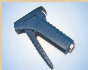
Manilla para pistola, no de artículo ..... 096060