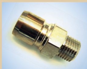
Acoplamiento macho para pistola Flex/Standard o pistola Quick (acoplado a la pistola, permite cambios rápidos de pistolas), no de artículo ..... 096069